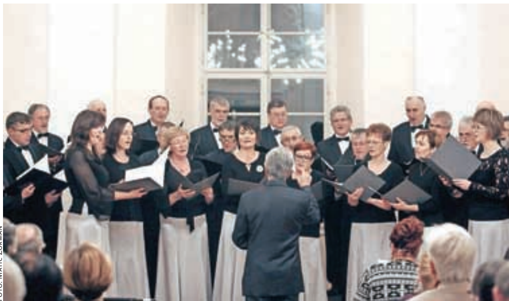
Nastopili so tudi Moška pevska zbor Podnart in Kropa ter Mešani pevski zbor Koledva.