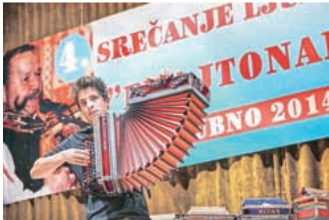
V Ljubnem so se letos že četrto leto zapored zbrali harmonikarji, samouki na frajtonaricah.