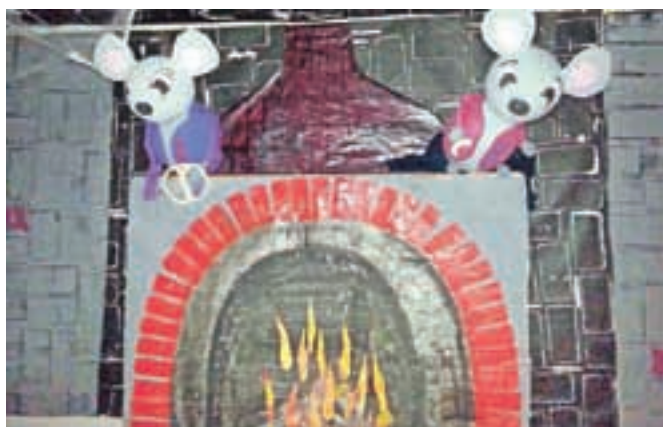
V Vrtcu na Brezjah so se delavke izredno potrudile in prostore okrasile v stilu Pekarne Mišmaš.