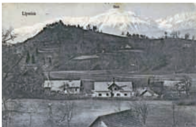
Lipnica, pred 1929 (DAR)