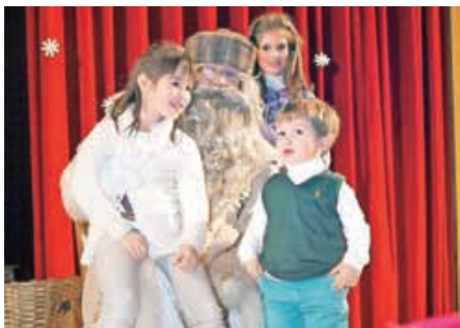
Dedek Mraz je vsakemu otroku dal darilo ter se z njim fotografiral za spomin.

Po predstavi je prišel težko pričakovani Dedek Mraz, ki je najmlajše nagovoril, ti pa so mu v zahvalo zapeli nekaj pesmi. Dobri mož je vsakega otroka poklical na oder in mu osebno predal darilo ter se z vsakim fotografiral za spomin. Pripravili so 110 daril, ki so jih prejeli vsi otroci do desetega leta starosti.