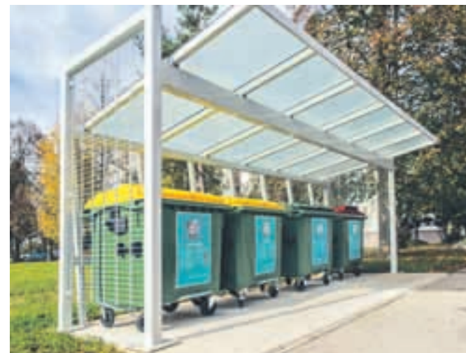
Ena izmed novih nadstrešnic za zbiralnico ločenih frakcij