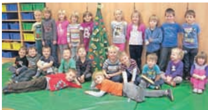
Mojstri izdelovanja eko smrečic iz vrtca Podnart

ekološkimi materiali. Med 500 vrtci so se uvrstili med 75 najboljših, ena od skupin je zasedla celo prvo mesto. Za nagrado so prejeli paket z izdelki organizatorjev natečaja, njihovi zmagovalni smrečici pa zdaj krasita Hoferjevi izložbi v trgovinah v Lescah in Trzinu.