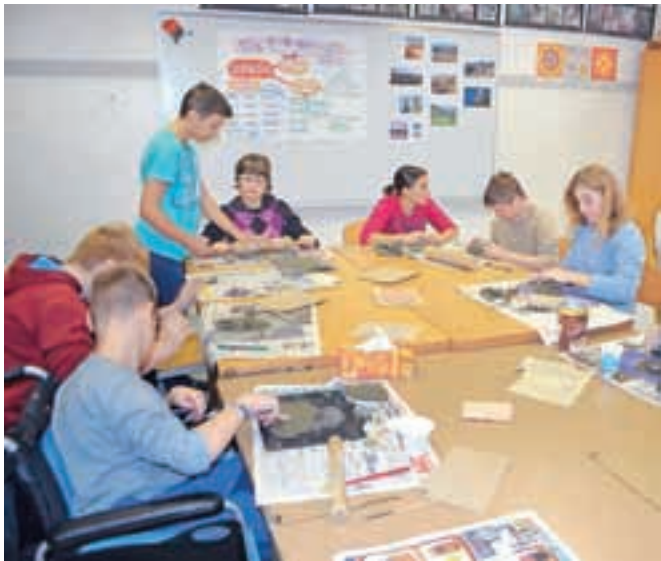
Učenci obeh šol so uživali v medsebojnem druženju.