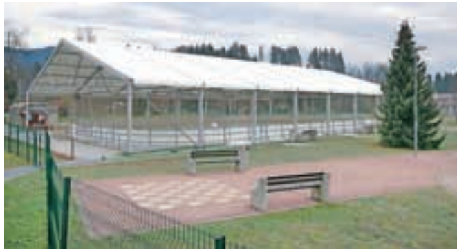
Drsalnišče je letos zaščiteno s streho, tako da je drsanje mogoče tudi ob slabših vremenskih razmerah.

Drsalnišče med tednom obratuje od 15. do 18. ure, ob sobotah, nedeljah in praznikih ter v času šolskih počitnic pa od 10. do 18. ure. Za otroke in mladino v starosti do 18 let ter vrtnice in šole občine Radovljica bo drsanje še naprej brezplačno. Vstopnice za odrasle rekreativce bodo tako kot lani naprodaj po dva evra, nespremenje-