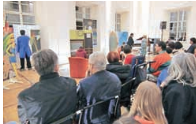
Na letošnji prireditvi sta se prepletali glasbena in gledališka umetnost.

Da varovanci VDC Radovljica niso prav nič odtujeni, so ob zaključku celoletnega projekta dokazala tudi priznanja najboljšim. To pa niso bile nagrade, kot jih poznamo iz bolj slovesnih proslav in dogodkov. Pri njih namreč ne šteje, kdo naredi več, kdo se manjkrat zmoti in kdo ima več. To so priznanja, ki nagrajujejo osebnost in osebnostne korake. Dobili so jih tisti, ki so nesebično pomagali, tisti, ki so v osebni rasti naredili korake na bolje, tisti, ki okolico razveseljujejo s svojo pozitivnostjo, tisti, ki se trudijo ne glede na to, kdo jih ob tem nagradi ali ne nagradi. Po kulturni prireditvi se je prireditev nadaljevala z bazarjem, kjer je med izdelki vsak lahko našel nekaj