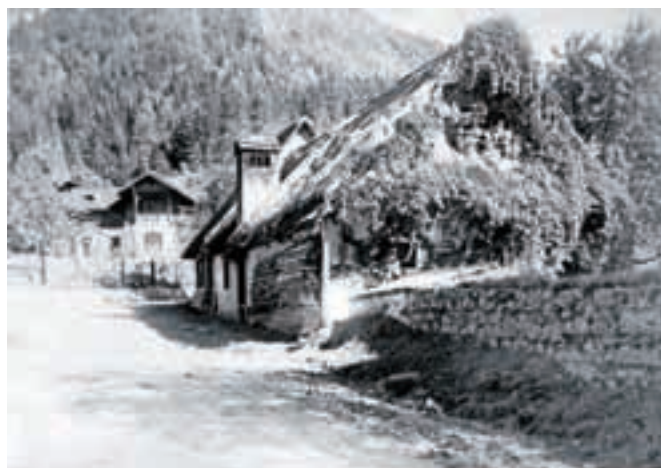
Rojstna hiša 1918

skupaj s sestro, nekdanjo šiviljo. Po sestrični smrti je zadnje leto svojega življenja, ko ni več mogel skrbeti zase, preživel v sobici, ki so mu jo dali v Psihiatrični bolnišnici v Begunjah. Tam je leta 1975 tudi umrl.