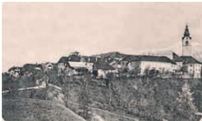
Radovljica z Gradišča, od. 1903