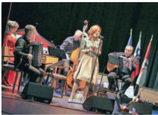
Na proslavi občinskega praznika v Linhartovi dvorani so občinstvo navdušili igralci Linhartovega odra in glasbeniki skupine Link.Art.