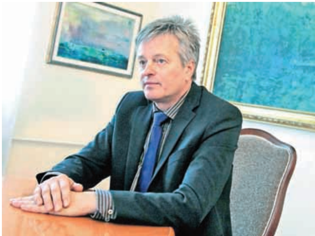
Župan Ciril Globočnik

Ker primanjkuje parkirišč, bo treba temeljito razmisliti o tem problemu. Trenutno se pogovarjamo o dolgoročni ureditvi baročnega parka, ki naj bi spet postal tak, kot je bil nekoč, pod park pa bi morda lahko umestili tudi večje parkirišče. Ena od možnosti je tudi parkirišče