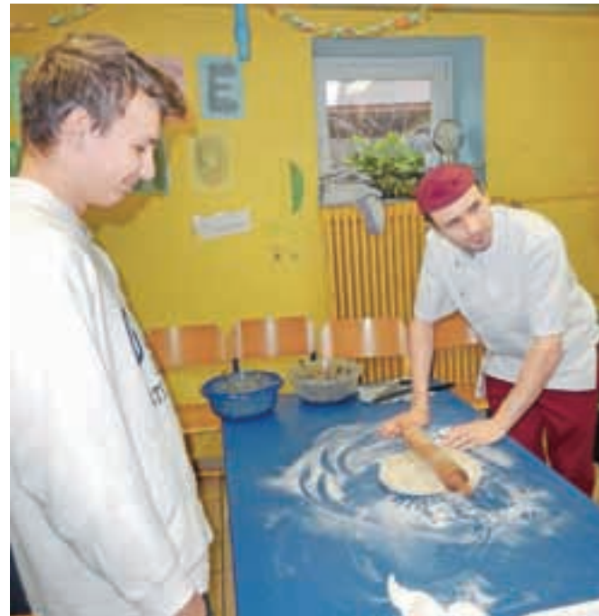
Medgeneracijsko sodelovanje poteka zlasti s povezovanjem udeležencev programa PUM, ki asistirajo v računalniških programih, skupaj z upokojenci kuhajo in sodelujejo v pumovskih projektih.