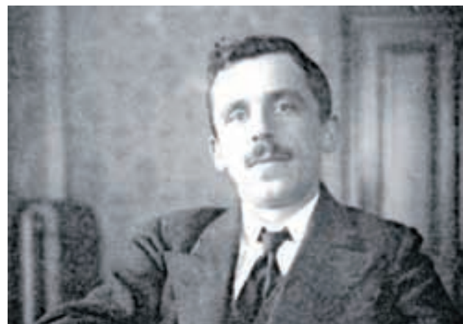
Kot sodnik pripravnik 12. marca 1915