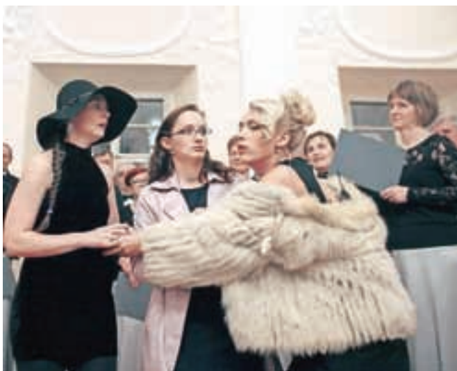
Igralci Kulturno-umetniškega društva Linhartov oder so Županovo Micko predstavili v sodobni preobleki.

Na prireditvi so nastopili tudi Moška pevska zbor Podnart in Kropa ter Mešani pevski zbor Koledva. Pod vodstvom letošnjega občinskega