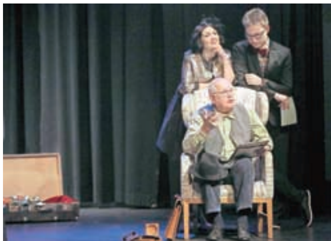
V odrski zgodbi je bil Linhartov duh povezan z deli Franeta Milčinskega Ježka, katerega stoto obletnico rojstva smo obeležili 14. decembra.